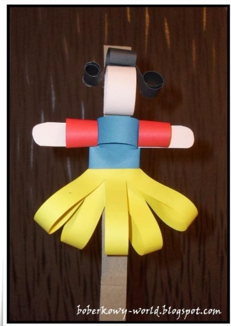
Księżniczki- kukielki z pasków papieru kolorowego