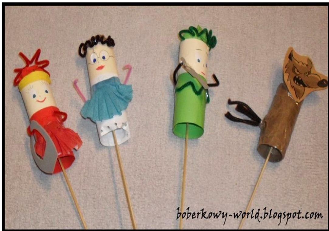
Czerwony Kapturek- kukielki z rolek po papierze toaletowym.